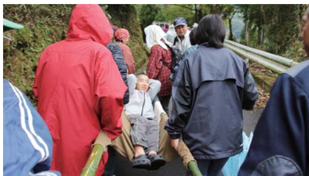
高台へ向け避難する住民

津波災害を想定した避難訓練が11月29日、荒瀬振興会で行われました。この訓練は同振興会が自発的に行っており、今年で4年目になります。午前10時に各家庭に引いてある有線放送からの避難指示を合図に海拔50メートルほどの高台に向け避難開始。リヤカーや簡易担架なども使われました。またでんぶん汁などの炊き出しも行われました。