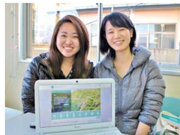
Kimotsuki Connection 2人で更新がんばります