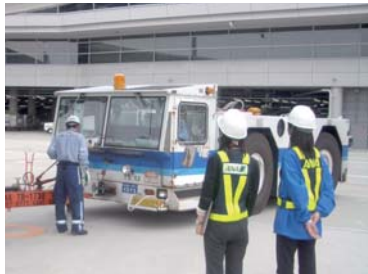
飛行機を押すトーイングトラクター