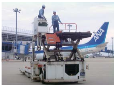
コンテナを上げ下げする ハイリフトローダー