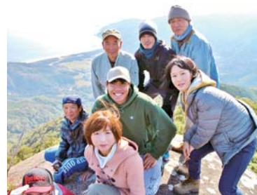
1月2日はテコテンドン! 今年も無事に迎えられました

実際に私も英語で文章を書いたりしていますが、最近はインターネットやスマートフォンアプリの翻訳性能が格段に向上していて、しかも使いやすい! 色々なツールを活用して、外国語や外国人に不慣れな人も一緒に、外国人にフレンドリーな町にしていけたらと夢見ています。Don't miss it!