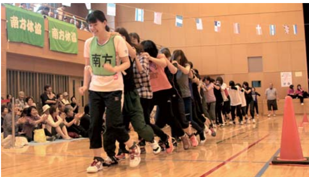
参加年齢制限なしのムカデ競走

岸良、北方、南方、旧内之浦町3地区合同の運動会が6月25日、内之浦銀河アリーナで開催されました。3回目となる同大会は地域住民が気軽に参加できるように、さまざまな種目を取り入れて行われます。 参加者らは「競うのではなく楽しむ運動会です。大会を通して地域のつながりがより一層深まりました」と話していました。