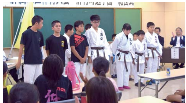
健闘を誓った選手たち

第17回肝属地区体育大会の肝付町選手団結団式が6月23日、町文化センターで開催されました。 陸上競技やバレーボール、柔道、剣道などさまざまな競技が行われる同大会に町からは273名が参加。 選手団の代表が「肝付町の代表として正々堂々と大会に挑みます」と決意の言葉を述べ、健闘を誓いました。