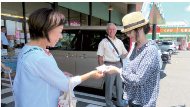
啓発用ティッシュの配布

「社会を明るくする運動」の強調月間の7月、肝属保護司会東部支部の保護司らを中心にキャンペーン活動が行われました。3日には、永野町長や肝付警察署長らが参加して出発式が行われた後、高山地区の中学・高校訪問、スーパーの駐車場での啓発用ティッシュの配布などが行われ、犯罪や非行の防止などを呼びかけました。