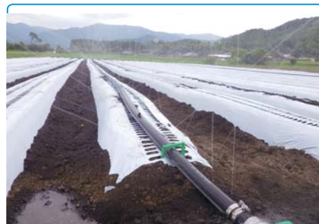
◎「散水チューブ（スミレイン40）」設置圃場（新ごぼう） 品種：山田早生 播種日：平成29年9月11日 ※ 晴れ間が続く時は夕方に散水します。