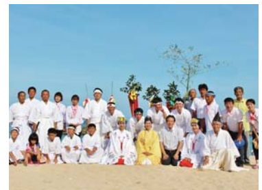
暑い中、ご観覧にお越しくださりありがとうございました!