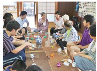
浜振興会のサロンなどにお邪魔し昔話をうかがいました

その一方で、私が感じている手応えや可能性を、まだうまく言葉にできていなかったりもしています。ただの行事に留まらない、意義がたくさん詰まったものとして実施できるよう、来年に向けて準備を進めていきたいと思っています。