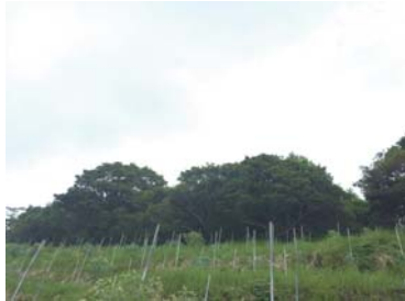
ユーカリ畑の上が購入した山林