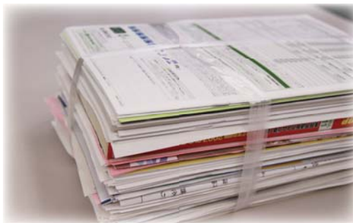
（資源ごみの分別内訳）