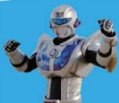
▲ 銀河連邦ヒーロー イプシリオン