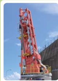
新型ランチャーも!