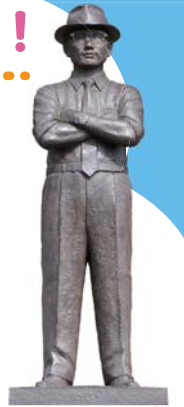
糸川英夫博士の銅像