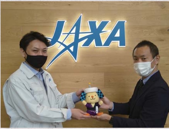
↑特別隊員に任命された「いて丸」

いて丸の他に、各銀河連邦共和国のゆるキャラ3体と共にカプセル落下予定地点のウーメラ砂漠（オーストラリア）に旅立ちました。特別隊員達の旅路の様子は町「Twitter (@kmt_kk_in)」、Facebook (@town.kimotsuki)