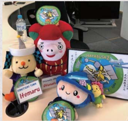
↑オーストラリアに到着！