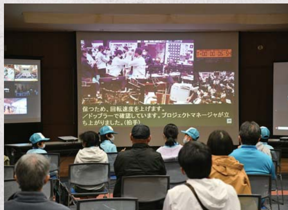
↑全員で分離の瞬間を見守りました

らYouTubeのJAXAチャンネルによるカプセル分離ライブイベントが開始されました。ライブイベントでは各共和国と中継がつながり、「はやぶさ2、がんばれ！」とJAXAの皆さんへメッセージを送りました。カプセル分離の時間が近づいてくると、管制室の緊張の様子が映像越しにも伝わってきました。カプセル分離が無事に成功したことが確認できると、全員で大きな拍手を送りました。