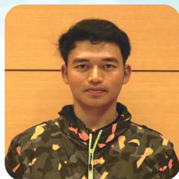
インドネシア出身

今回は、町内で働く3人の皆さんにインタビュー。彼らの素顔を知れば、今度町で出会ったときの距離が、グッと縮まるはずですよ。