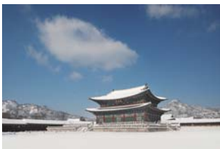
▲景福宮 勤政殿 ©文化財庁 (大韓民国)