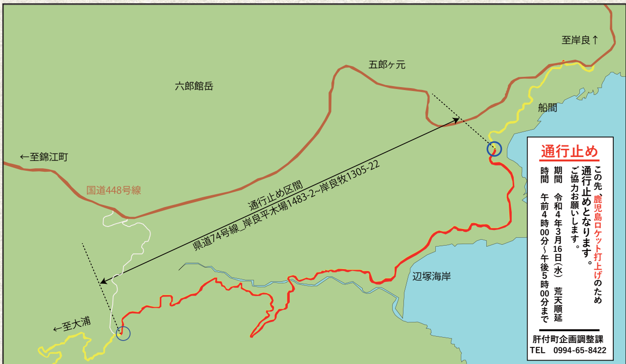
打上げ日の通行止め区間（通行止め看板①の位置から辺塚海岸まで）