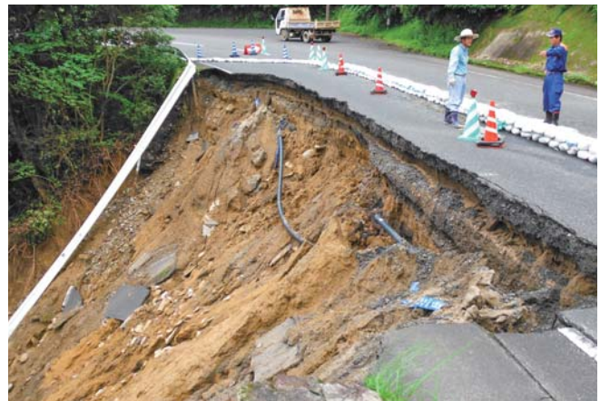
▲内之浦 宮原付近 (2012.6.30)

● 避難基準を知る 1時間降水量が20mm以上となり、降り始めからの降水量が100mm以上になったときは、雨に対する注意が必要です。さらに1時間降水量が50mm以上となった場合は、災害が発生するおそれがあります。 雨の多い地域で生活する私たちは日ごろから、周囲の河川浸水想定区域や土砂災害警戒区域の確認、避難場所や避難経路の確認、非常持出品の準備など、大雨に備えることを心がける必要があります。