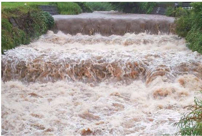
▲内之浦 待金付近 (2012.6.27)