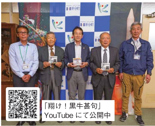
「翔け！黒牛甚句」 YouTubeにて公開中

黒牛甚句を肝属地区の予選会場で流したり、地区内の町を表敬訪問したりと、精力的に活動を行い、肝属地区の生産者の皆さんを応援しています。