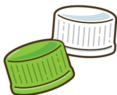
キャップとラベル