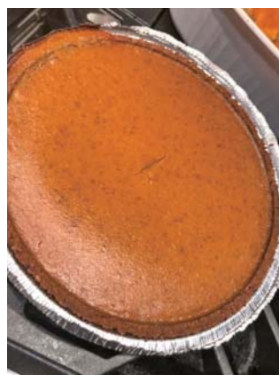
▲さつまいものキャセロール

を和えて焼いたもの)などもよく食べられています。家族で集まるのが難しい場合もありますが、この日に集まってお祝いをする事はアメリカ人にとってとても大切なことなので、家族の代わりに友人たちが集まり、「フレンドギビング」(Friendsgiving)と呼ぶこともあります。皆さんもこの日は家族・友達に感謝をしながら、美味しい食事を楽しむ一日にしませんか？