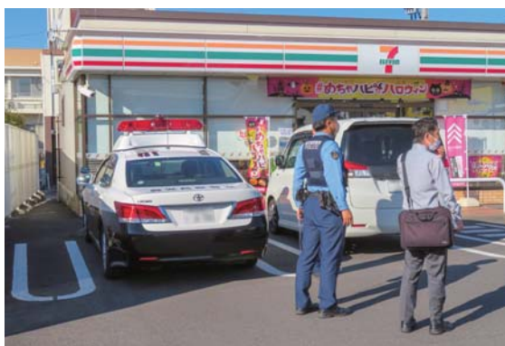
店舗内で、訓練がうまく行われているか、確認をしている肝付警察署署員2名

また、訓練終了後には、街頭キャンペーンを行い、防犯広告用のティッシュや絆創膏などを退店するお客さんに配布し、防犯意識を高めるよう訴えました。