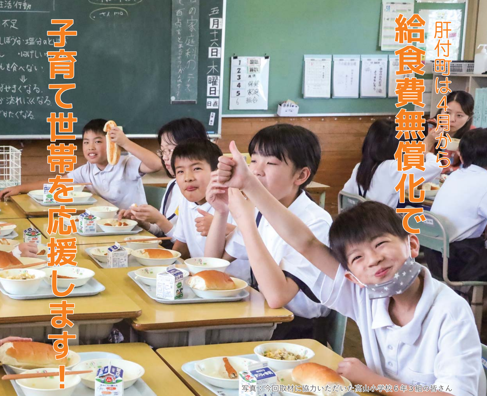
写真：今回取材に協力いただいた高山小学校6年3組の皆さん

肝付町は社会全体で子育てをするという観点から、子育て家庭の生活の安定と子どもの健全な成長を支援するために、さまざまな子育て支援を行ってまいりました。