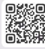
ふるさと チョイス