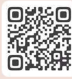
ふるさと チョイス