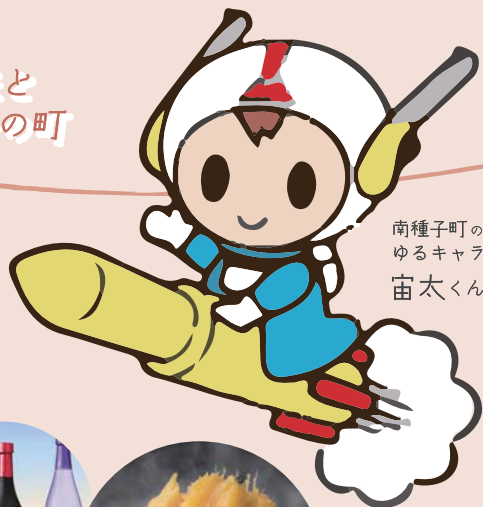
南種子町の ゆるキャラ 宙太くん