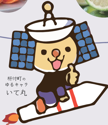
肝付町の ゆるキャラ いて丸