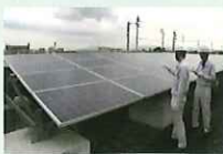
太陽発電設備の検査の様子

使用済みとなった太陽光パネルには、再販売可能なものもあり、既に多くのリユース事例が報告されています。