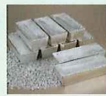
有用金属(銀)のイメージ