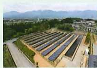
リユース品を使用した発電所