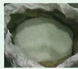
破碎・選別したガラス