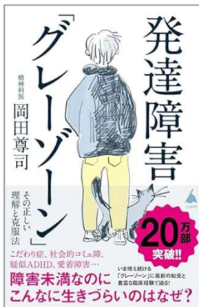
発達障害「グレーゾーン」 その正しい理解と克服法 岡田尊司 著