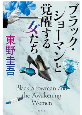
ブラック・ショーマンと 覚醒する女たち 東野圭吾 著