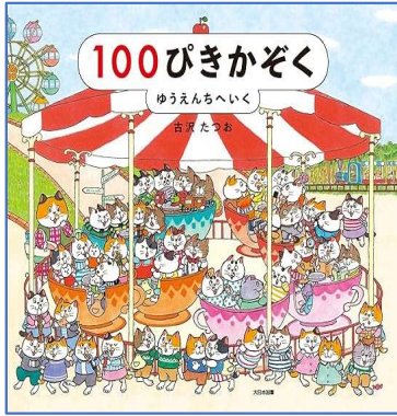
100匹かぞく ゆうえんちへいく 古沢たつお 作