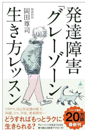
発達障害「グレーゾーン」 生き方レッスン 岡田尊司 著