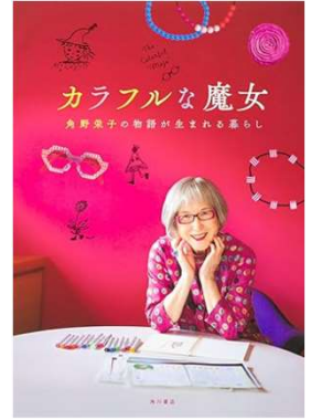
カラフルな魔女 角野栄子の物語が生まれる暮らし KADOKAWA監修