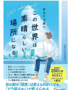
あなた次第でこの世界は素晴らしい場所になる ひすいこたろう 著