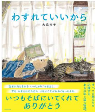
わすれていいから 大森裕子 作