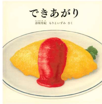
できあがり 彦坂有紀・もりといずみ 作