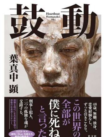
鼓動 葉真中顕 著