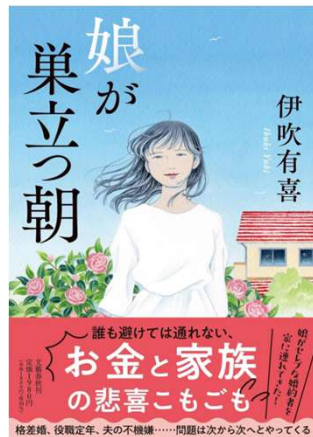
娘が巣立つ朝 伊吹有喜 著