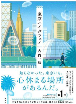
東京ハイダウェイ 古内一絵 著