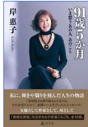
「91歳5か月」いま思うあの人のこと 岸恵子 著