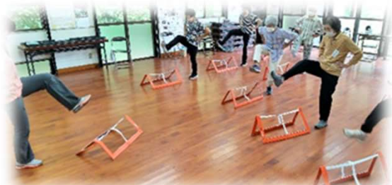
ペナルティーボックスを使った運動! チョットきつい(-_-;) それもそのはず 「罰ゲーム」です(笑)