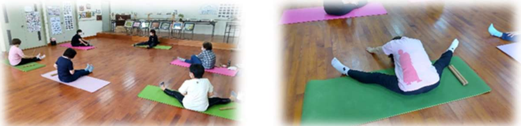
マットの上で楽しく健康体操に取り組む受講生の皆さん