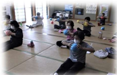
ボールを使った運動! 楽しい!