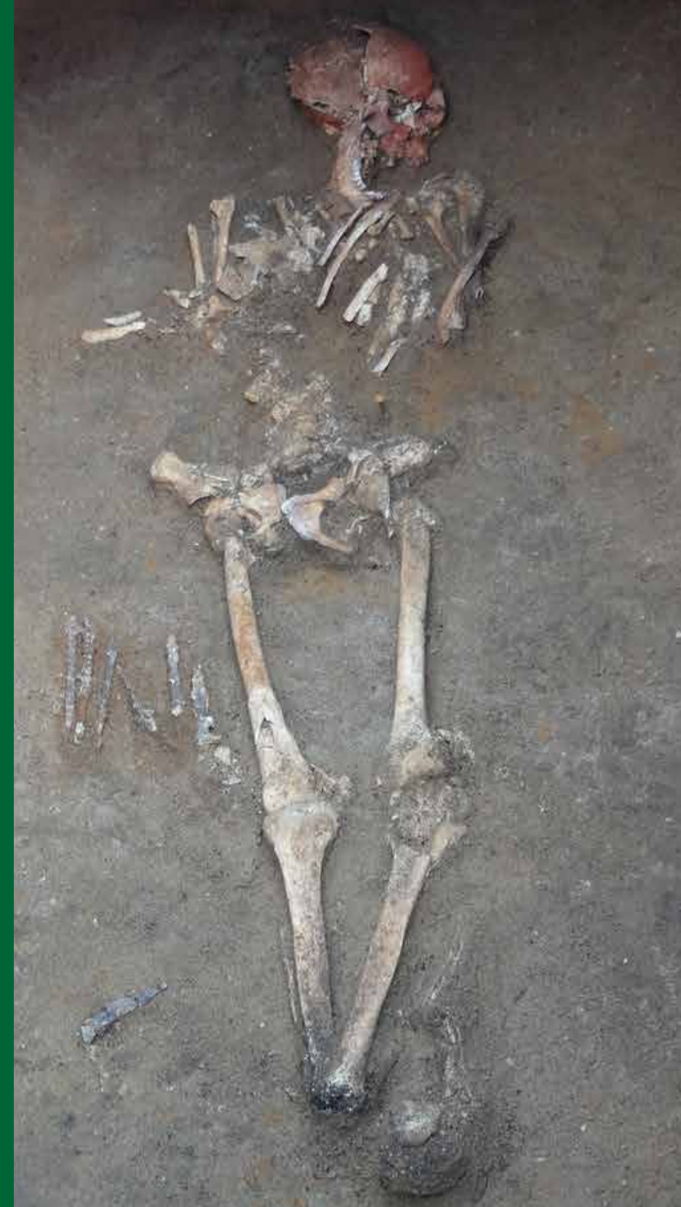
【地下式横穴墓29号より 発見された人骨】 (地下式横穴墓29号)