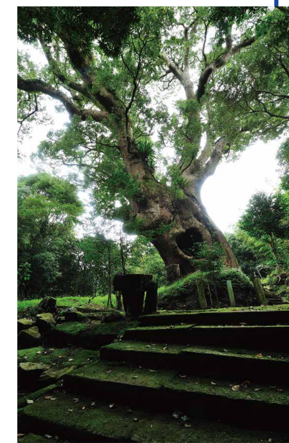
【塚崎のクス】(国指定天然記念物) 高さ25m、幹回り14mクスの根元には塚崎1号墳があり、非常に神秘的な雰囲気が漂うます。