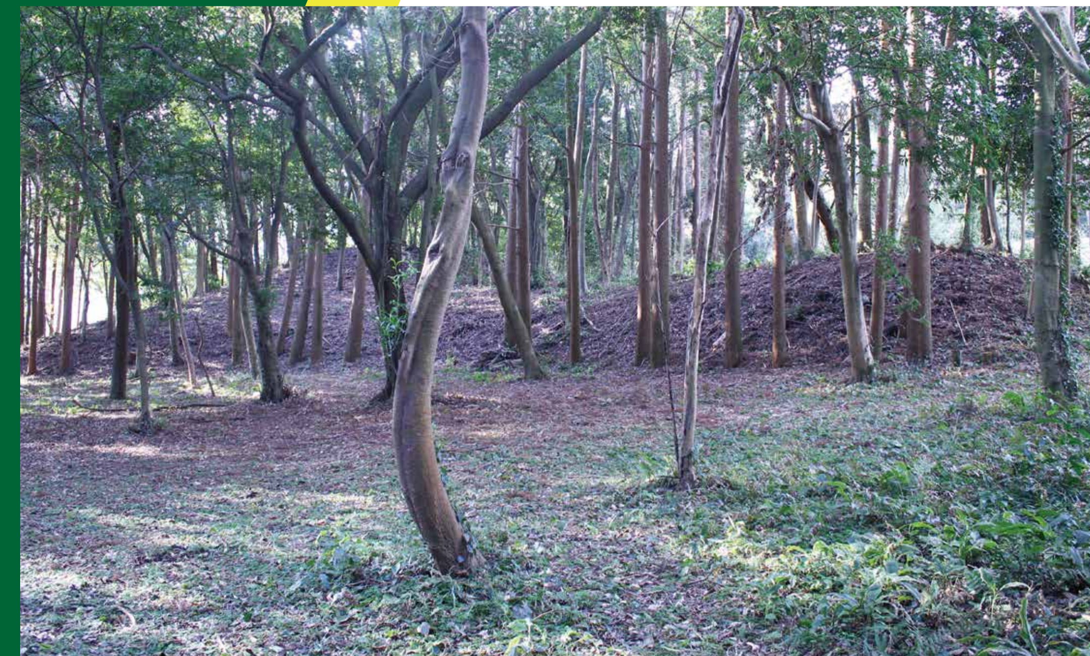
【大隅で最初に造られた 前方後円墳】(11号墳)