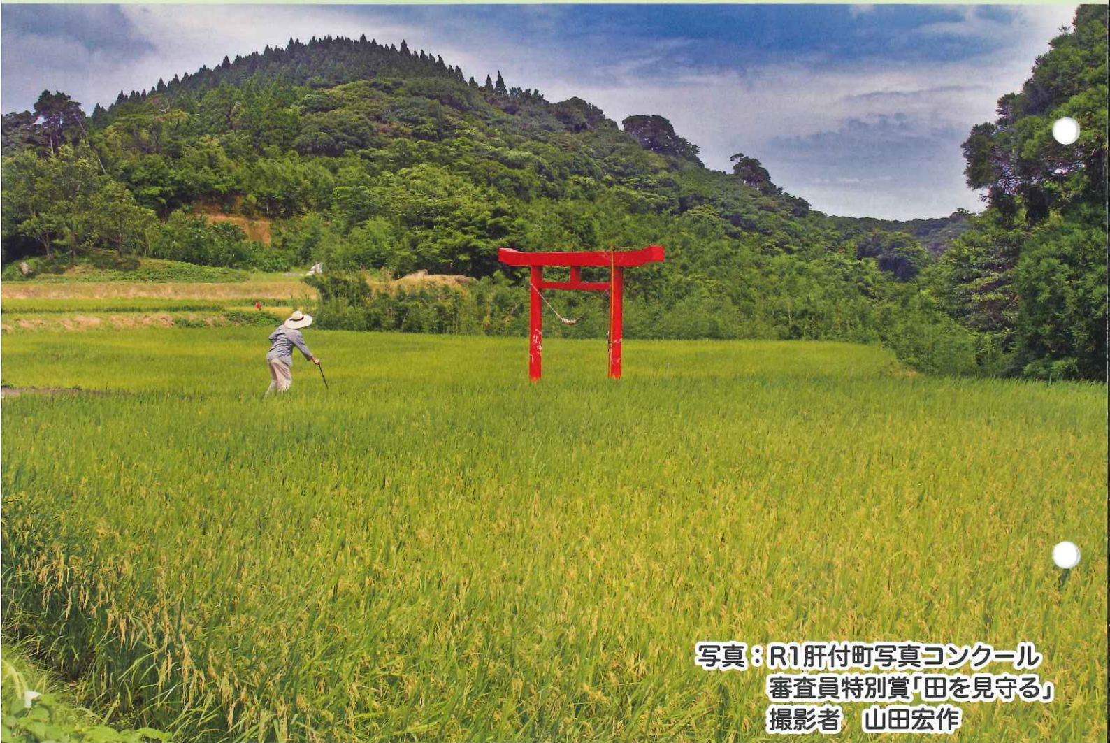
写真：R1肝付町写真コンクール 審査員特別賞「田を見守る」

編集・発行 肝付町農業委員会 肝属郡肝付町新富98番地 TEL (0994) 65-8418(直通)